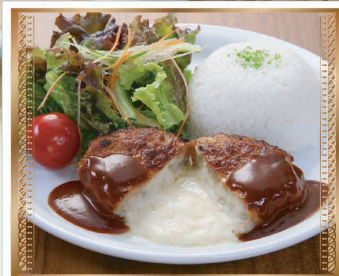
とろけるチーズインハンバーグプレート