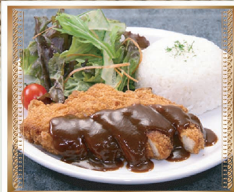
チキンカツプレート