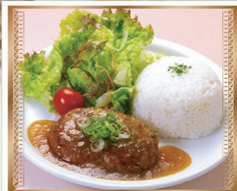
和風おろしハンバーグプレート