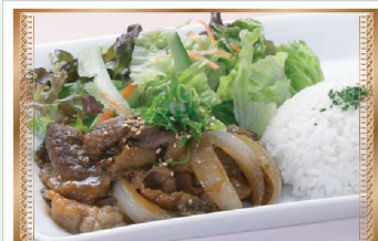
カルビ焼肉プレート