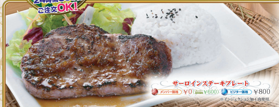
サーロインステーキプレート

90分以内では、メンバー追加価格でのご提供となります。なお、ビジター様はビジター価格となります。