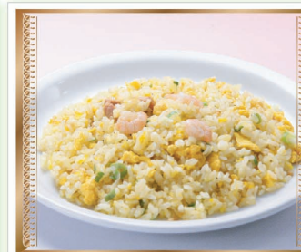
炒め卵チャーハン