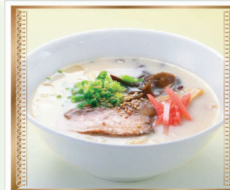
博多風とんこつラーメン