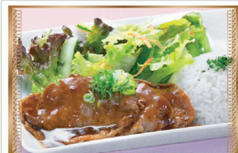
豚ロース生姜焼きプレート