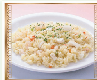
シーフードピラフ